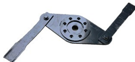
ACCESORIO PLATO DESMALEZADORA PARA DESBROZADORA